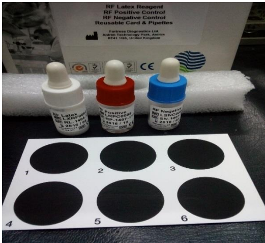
Reagen Rheumatoid Faktor