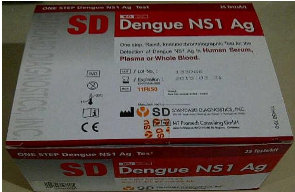
FOTO 1. BOX RAPID TEST NS1 DENGUE