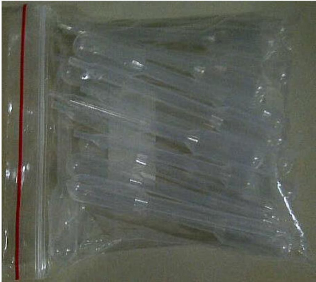
FOTO 5. DISPOSABLE DROPPER