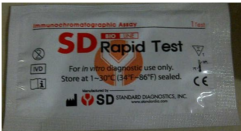
FOTO 2. KEMASAN PERANGKAT RAPID TEST NS1 DENGUE