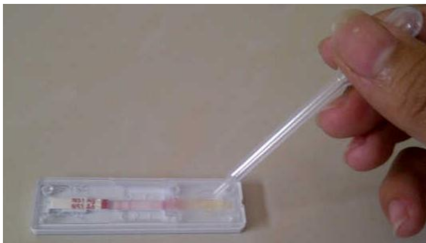
FOTO 6. PERANGKAT RAPID TEST NS1 DENGUE