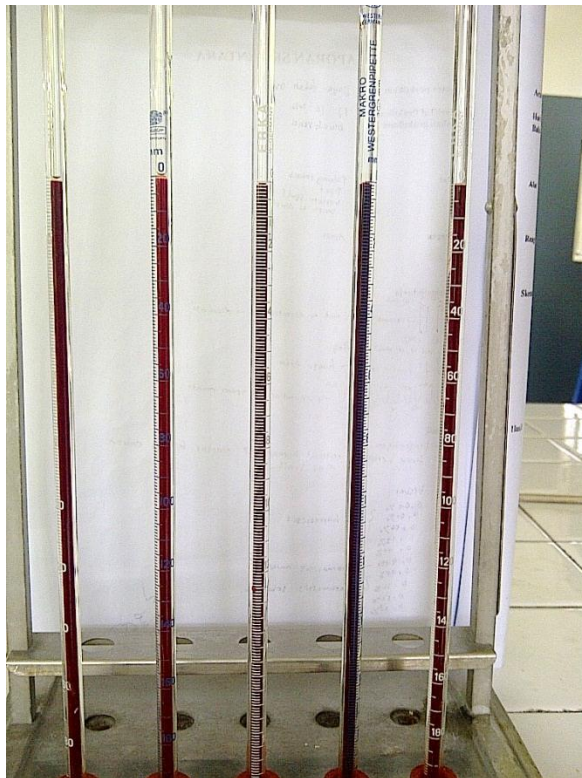
Pemeriksaan LED Metode Westergren