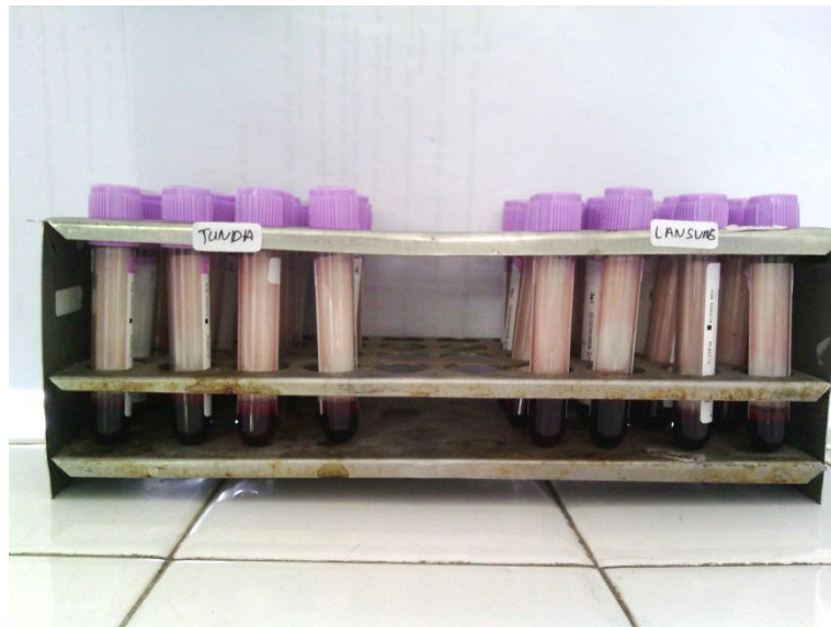
Sampel Darah EDTA