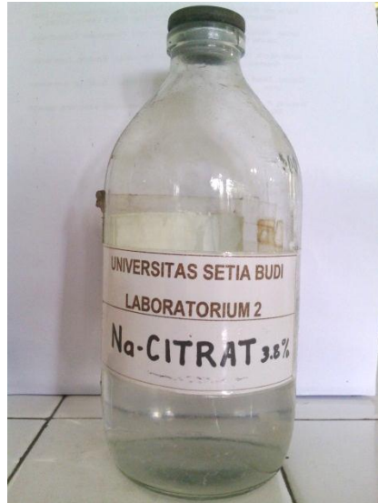
Na Citrat 3,8%