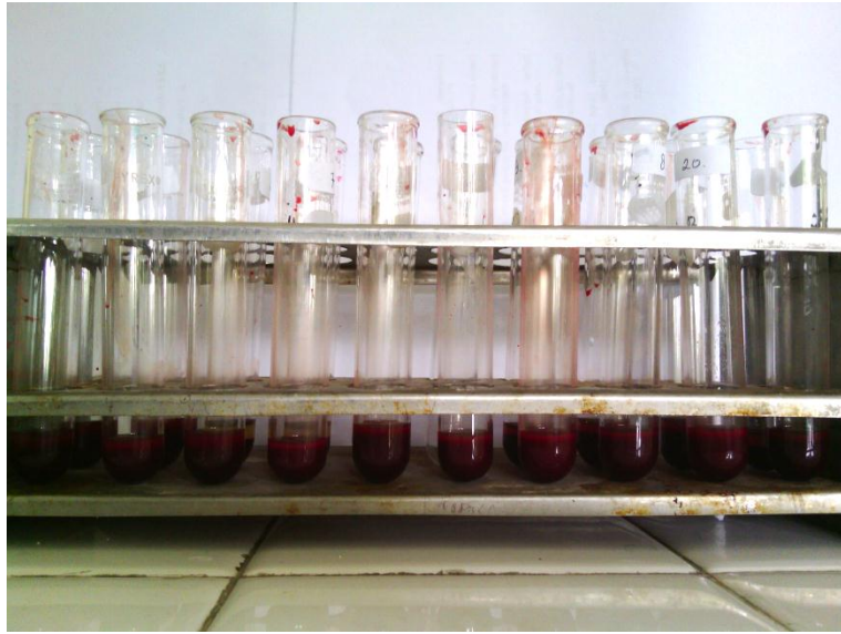
Sampel Darah (Ditambah Na Citrat) Pemeriksaan yang Ditunda 2 Jam LED