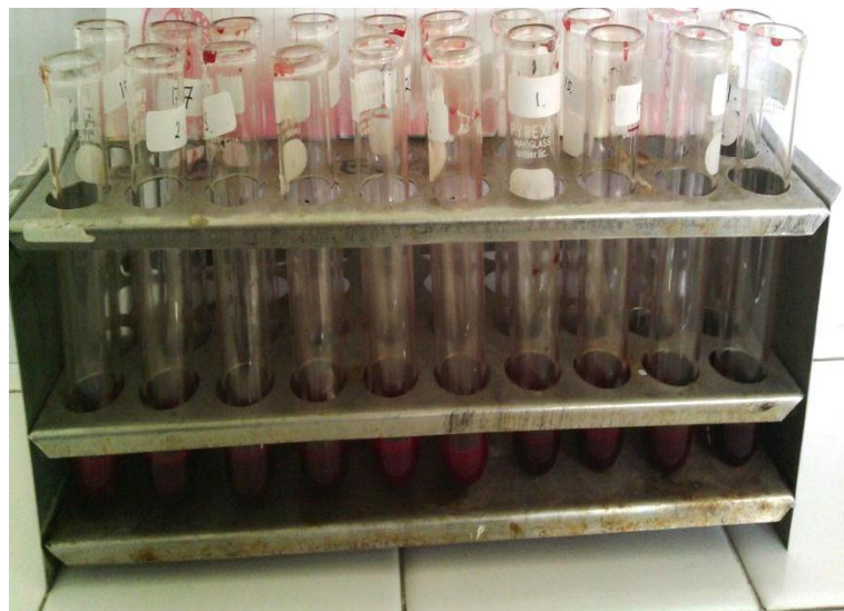
Sampel Darah (Ditambah Na Citrat) Pemeriksaan Langsung LED