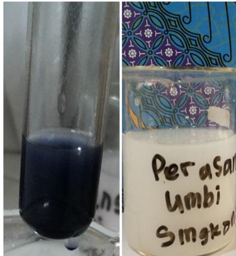
Gambar 11. Perasan Umbi Singkong