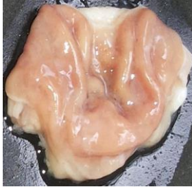
Gambar 16. Lambung dengan skor 0