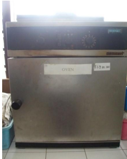
Gambar 14. Oven