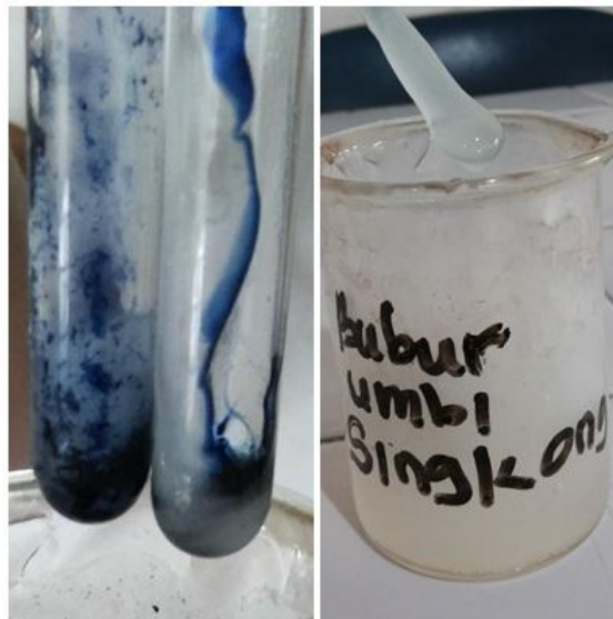
Gambar 13. Bubur Pati Singkong