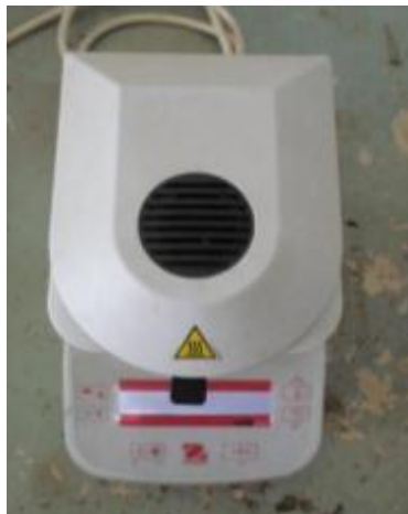
Gambar 15. Moisture Balance