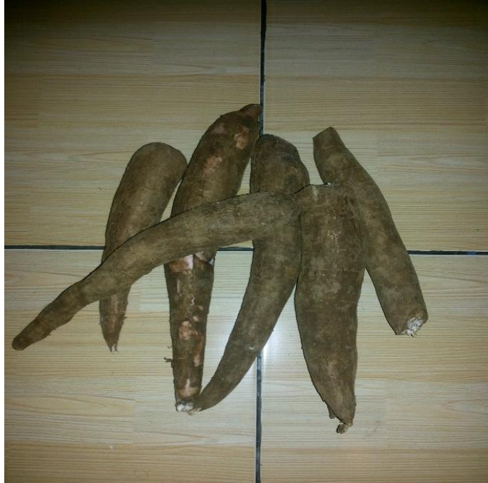
Gambar 9. Umbi Singkong ( Manihot utilissima Pohl.)