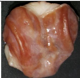
Gambar 18. Lambung dengan skor 2