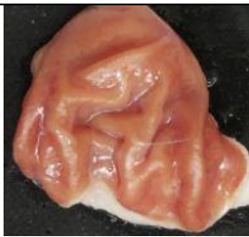
Gambar 17. Lambung dengan skor 1