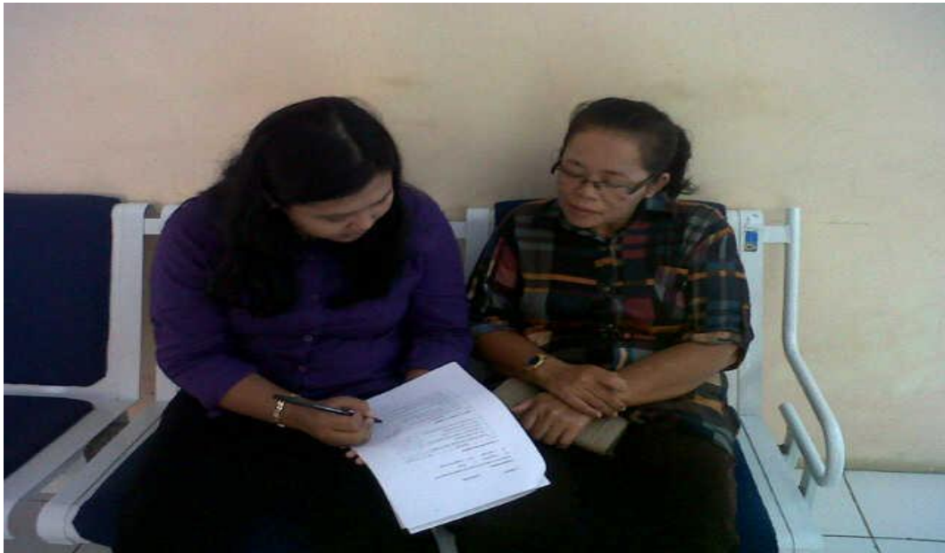
Lampiran 14. Foto penelitian