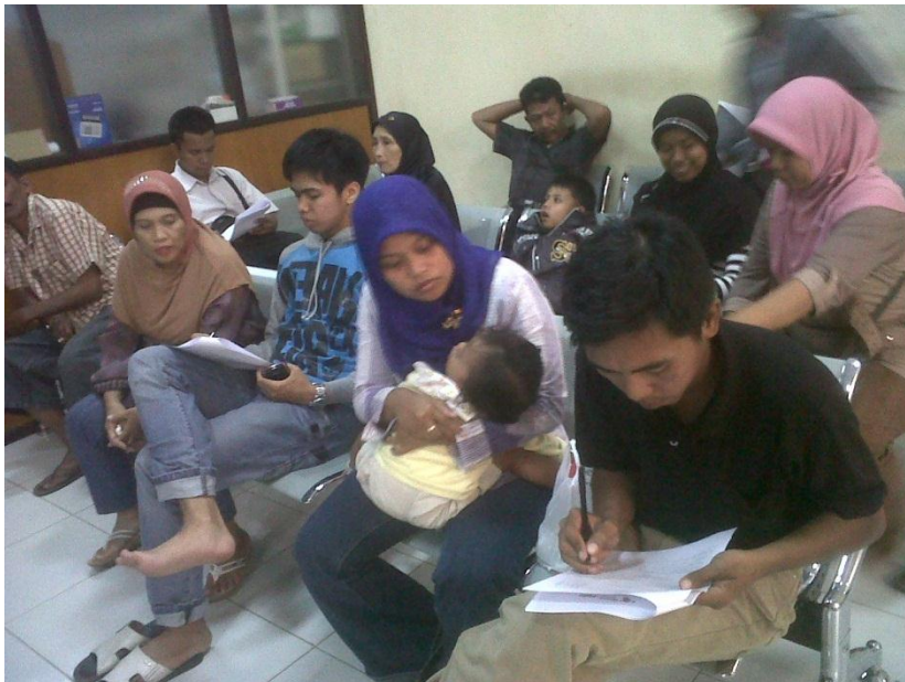
Gambar 4. Pengambilan sampel uji validitas dan reliabilitas