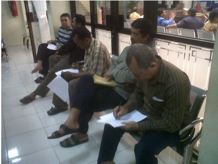
Gambar 5. Pengambilan data kepuasan pasien