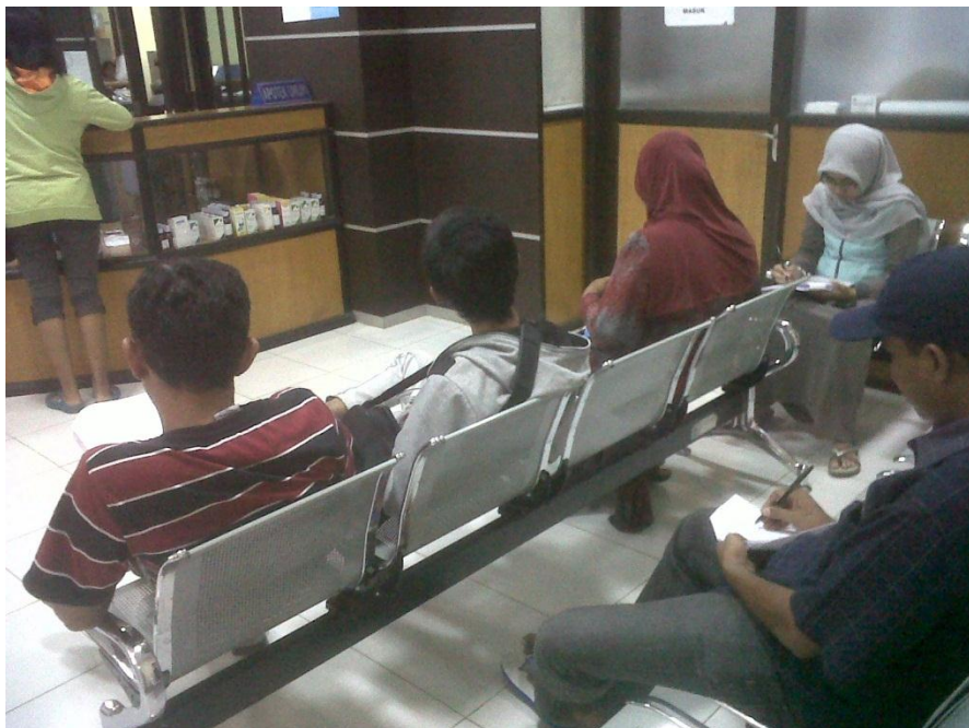
Gambar 6. Pengambilan data kepuasan pasien