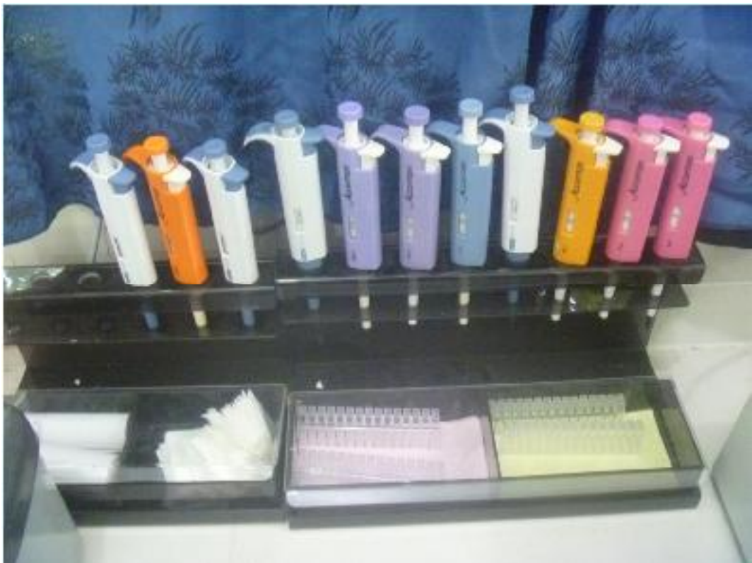
Clinipette dan cuvet