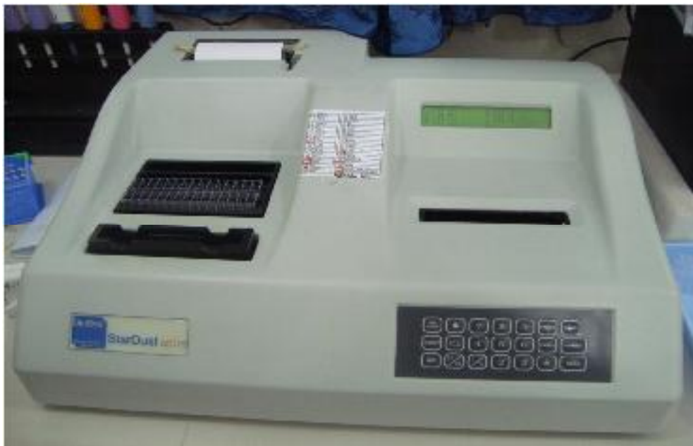
Fotometer Stardust MC-15