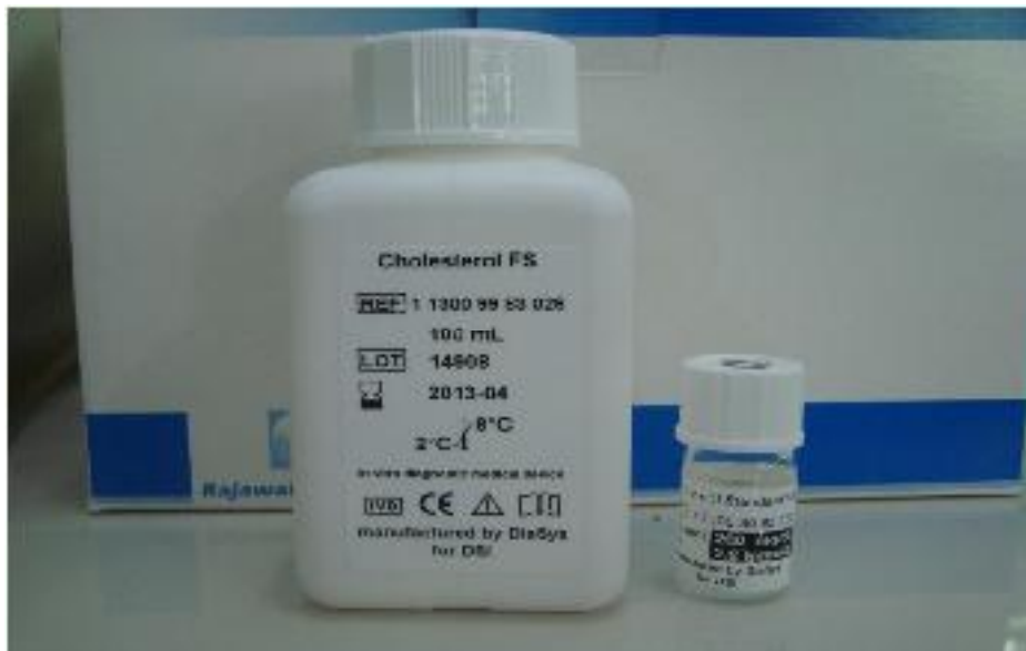
Reagen dan Standart Kolesterol