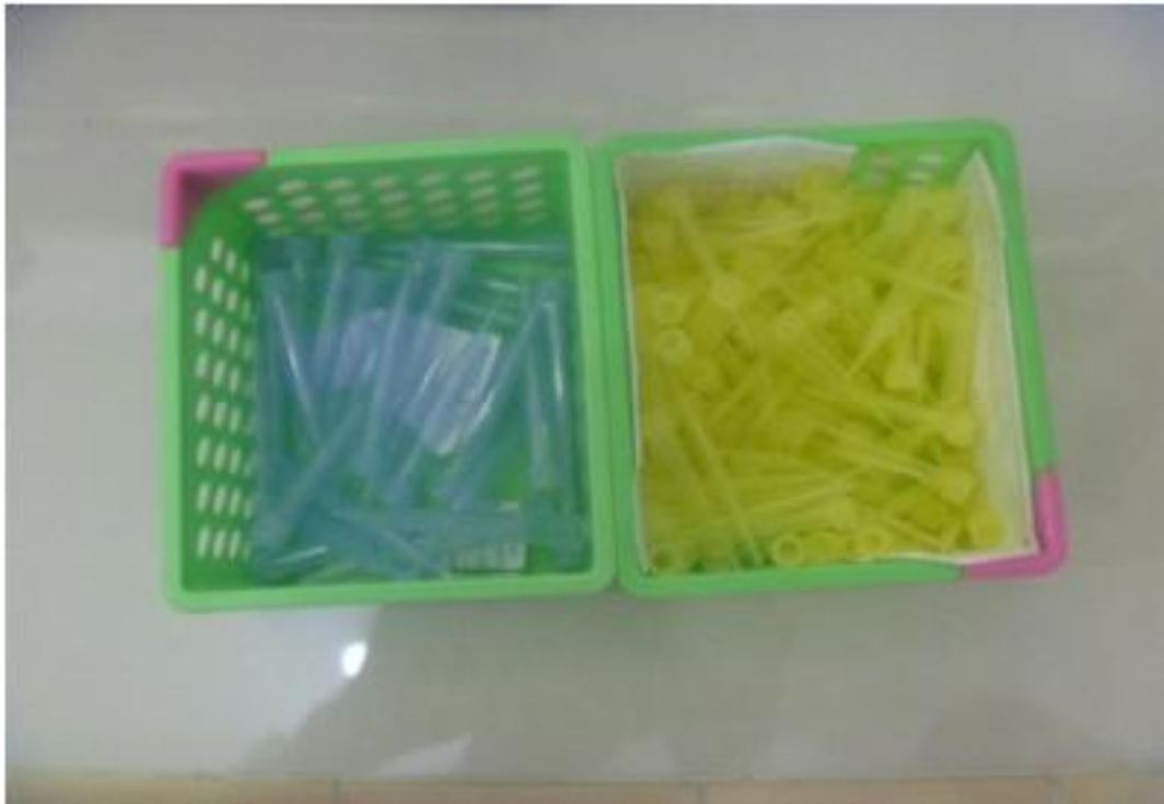
Blue tip dan Yellow tip