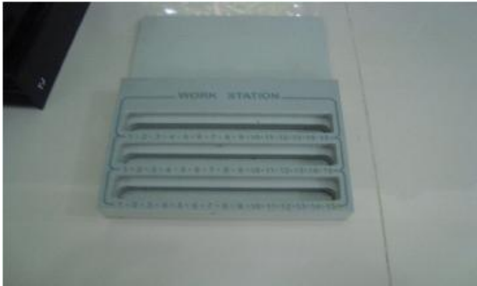
Wadah untuk cuvet