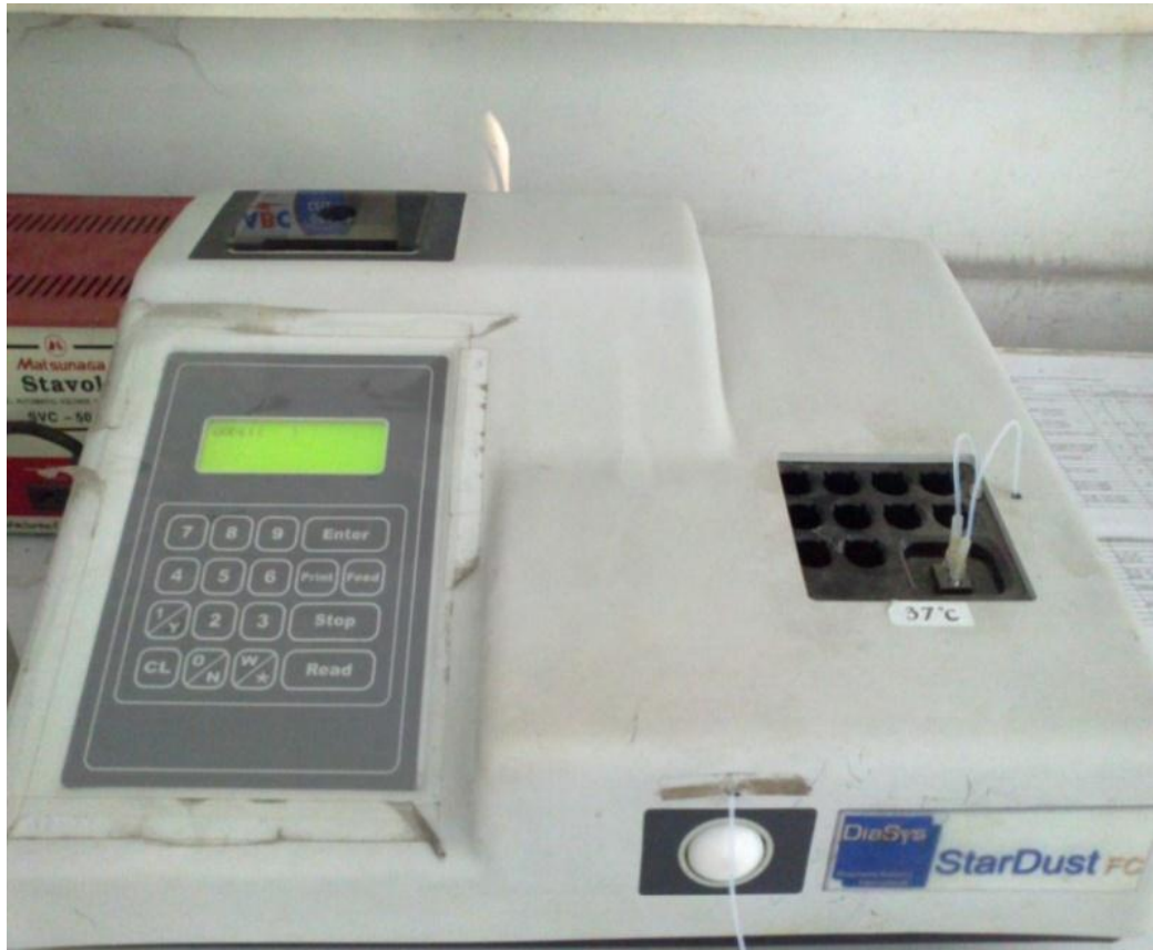
Gambar 1. Fotometer StarDust FC