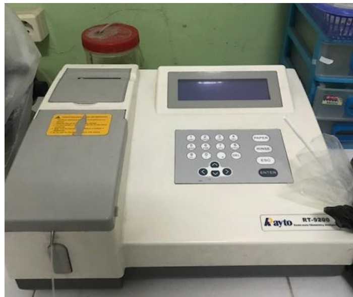
Fotometer Rayto RT-9200