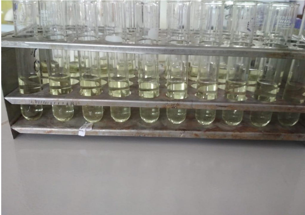
Foto Reagen Drabkins ditambah darah EDTA