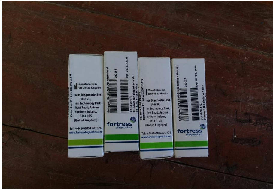
Reagent Golongan Darah