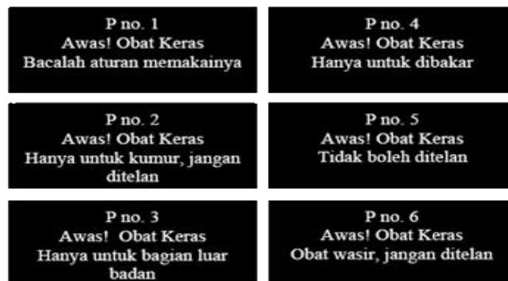
Gambar 12. Tanda Peringatan pada Obat Bebas Terbatas