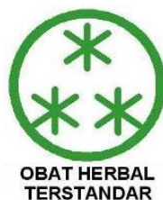
Gambar 17. Logo Obat Herbal Terstandar