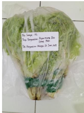
(2) Hypermart Solo Grand mall