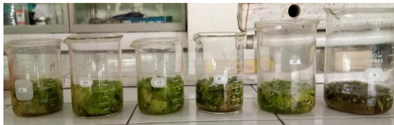
Metode pengendapan NaOH 0,2%