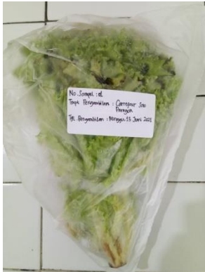
(1) Carrefour Solo Paragon