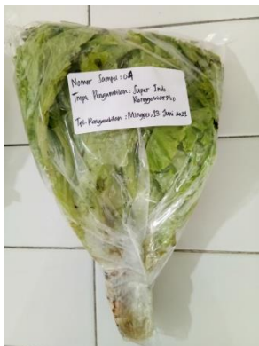
(4) Superindo Ronggowarsito