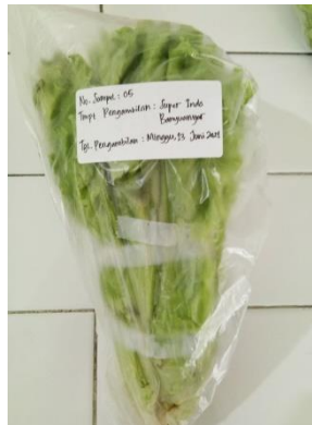
(5) Superindo Banyuwangi