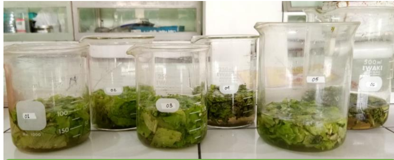
Metode pengapungan NaCl jenuh