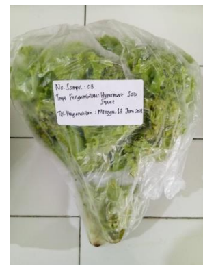
(3) Hypermart Solo Paragon