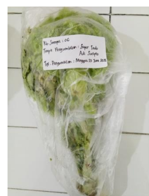
(6) Superindo Adi Sucipto

Sampel sayuran selada dari Supermarket Surakarta