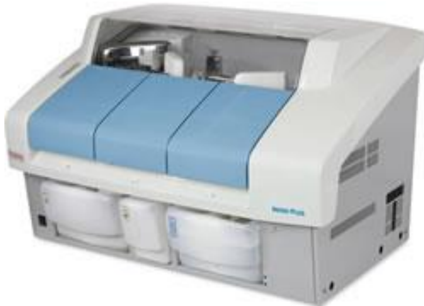
Lampiran 4. Gambar Alat Chemistry analyzer Indiko Plus REF 98640000