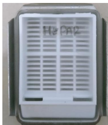
Cetakan base mold