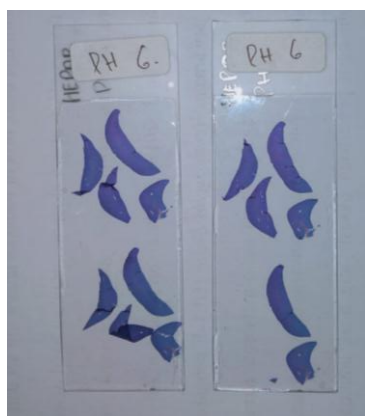
Preparat hepar mencit dengan pewarnaan hematoxylin eosin perlakuan III pH eosin 6