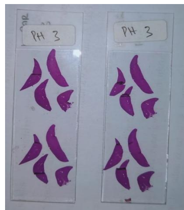
Preparat hepar mencit dengan pewarnaan hematoxylin eosin perlakuan II pH eosin 3