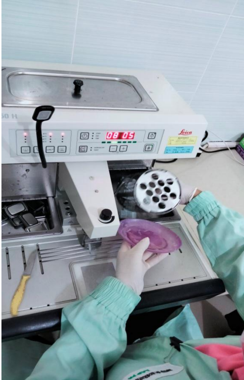
Proses memasukkan jaringan kedalam parafin