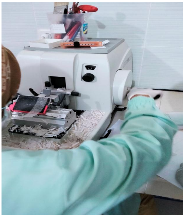
Pemotongan mikros dengan mikrotom