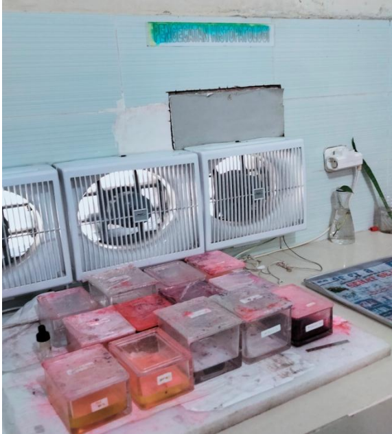
Pengecatan Hematoxylin dan Eosin