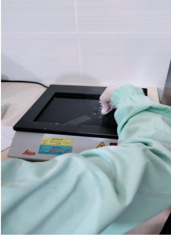
Penangkapan pita jaringan