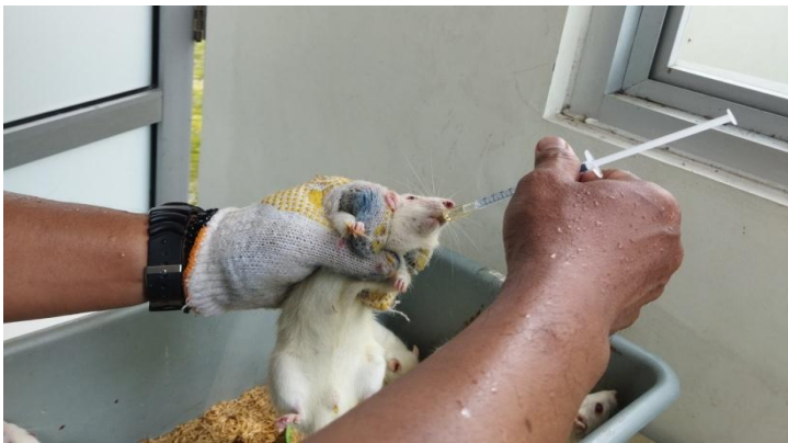
Proses penyondean pemberian karbofuran secara oral