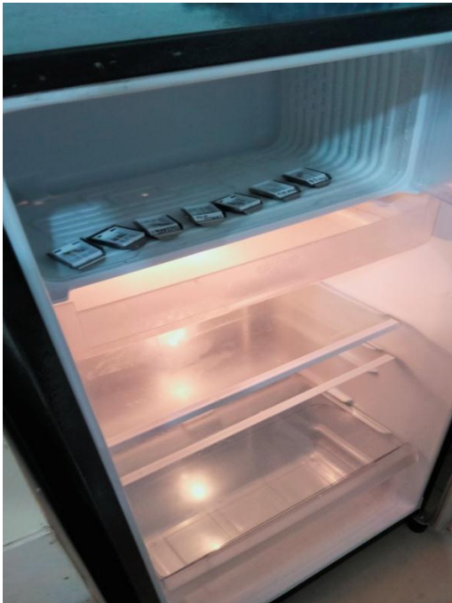
Proses pendinginan dengan kulkas