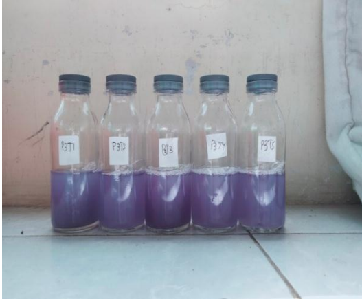
Karbofuran dosis 1,5/kgBB