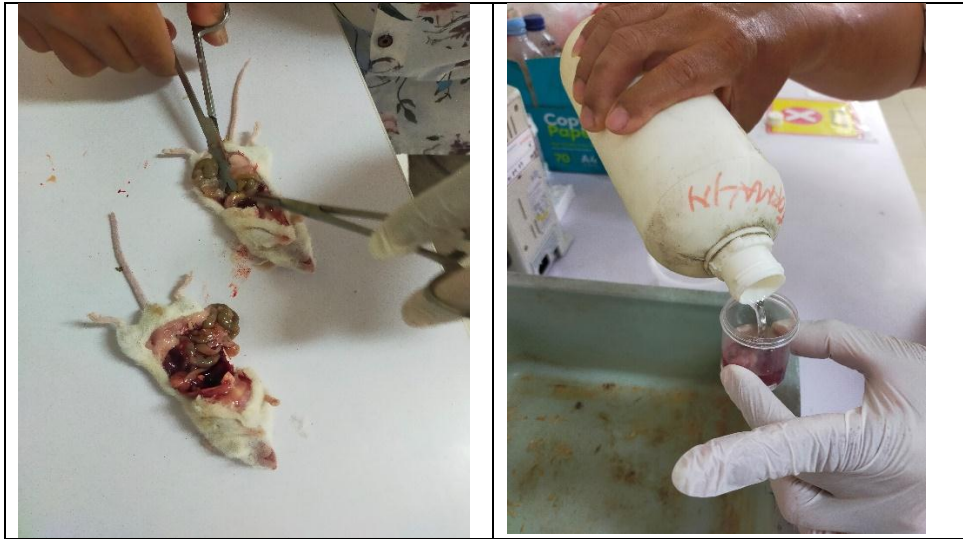
Lampiran 2. Proses jaringan