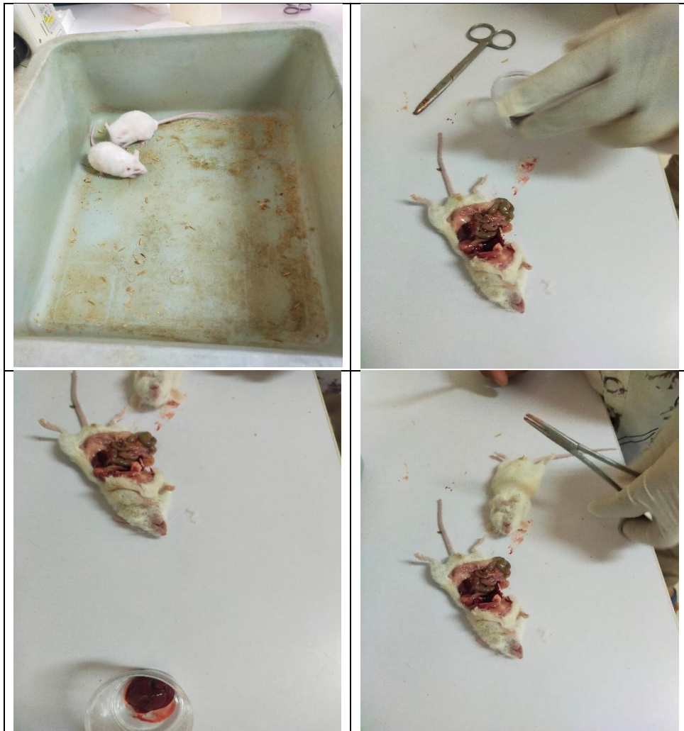
Lampiran 1. Proses pengambilan organ hewan