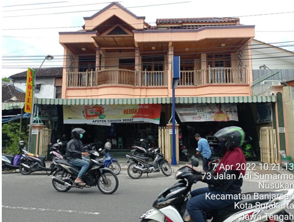
Lampiran 3. Tempat Penelitian