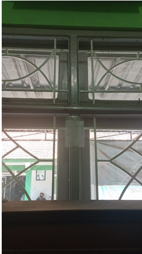
Gambar 4. Jendela Bertralis