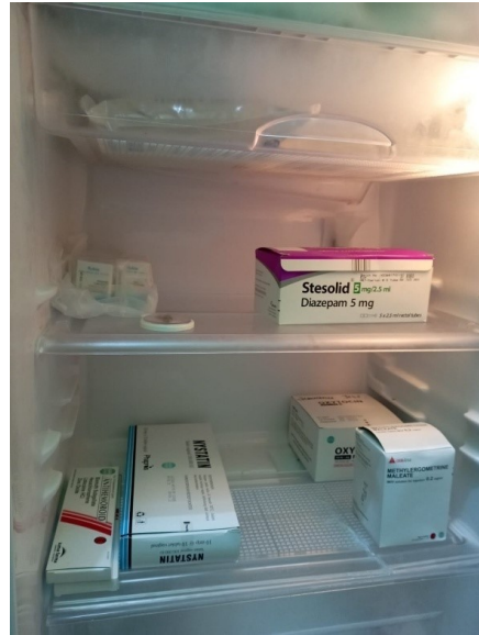
Penyimpanan Obat di Kulkas