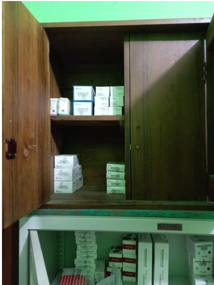
Lemari Penyimpanan Psikotropika