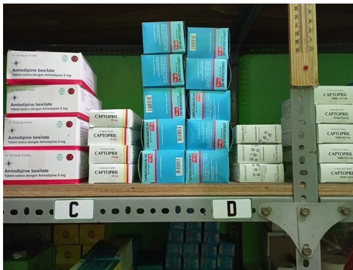
Rak Penyimpanan Obat