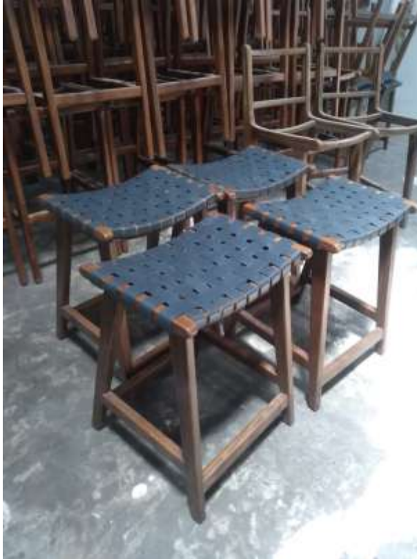
Gambar 31 Kursi Model Anyaman