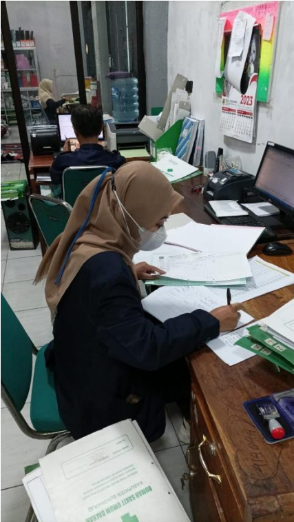
Lampiran 5. Proses pengambilan data di ruang Rekam Medis