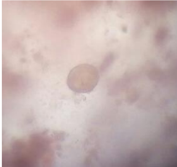
Telur Ascaris lumbricoides