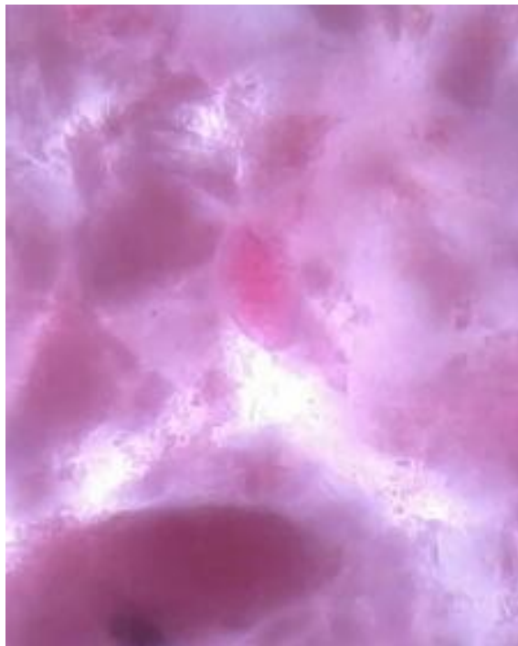
Telur Ascaris lumbricoides