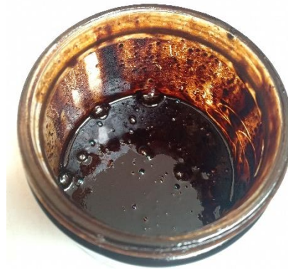
ekstrak buah belimbing wuluh