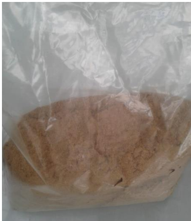
Serbuk buah belimbing wuluh