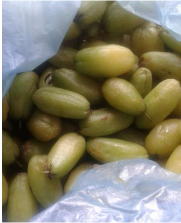
Buah belimbing wuluh